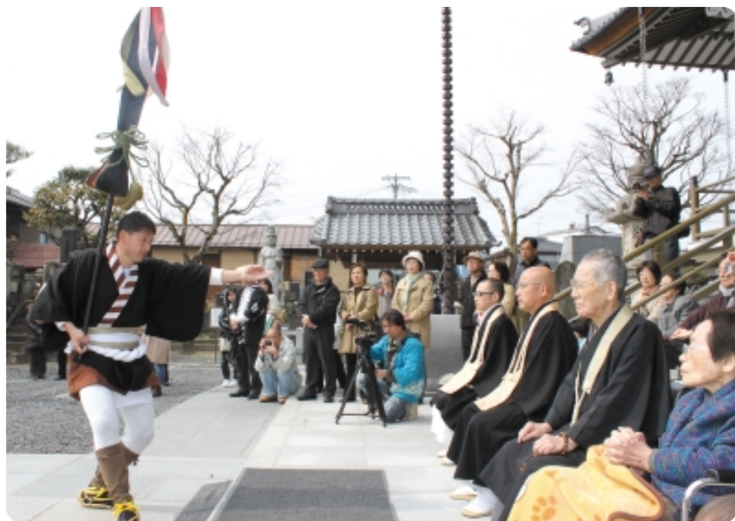
飯田「お練り祭り」柏心寺三代住職整列「大名行列」ご所望